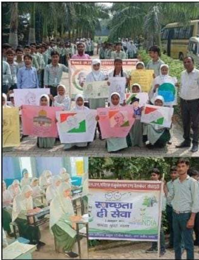
गांधीजी के जीवन के महत्व व विचारों पर चित्रकला प्रतियोगिता आयोजित की गई, इसमें भी रुशदा

एम, एन, पब्लिक एजुकेशनल एण्ड वेलफेयर सोसाइटी द्वारा चलाया गया स्वच्छता अभियान